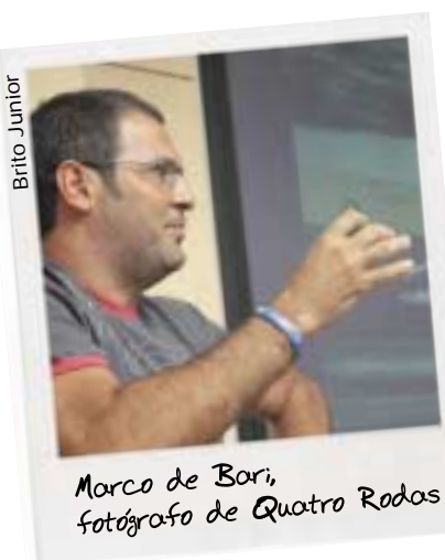
Marco de Bari, fotógrafo de Quatro Rodas