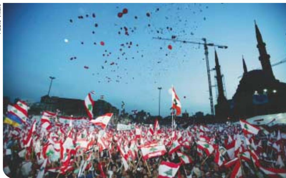
Beirute, Líbano. Em março de 2005, Vitale registrou a manifestação contra a presença síria no país

Outro ponto difícil é o desafio de se manter sempre atualizado. A avalanche tecnológica faz com que novos equipamentos surjam a cada instante e superem os já existentes. “É preciso estar de olho em tudo isso”, aponta Bari. Mas não se trata apenas de uma questão técnica – buscar ângulos inusitados e linguagens diferentes também é imprescindível aos profissionais da atualidade. E aí se incluem, é claro, aqueles em início de carreira. ::